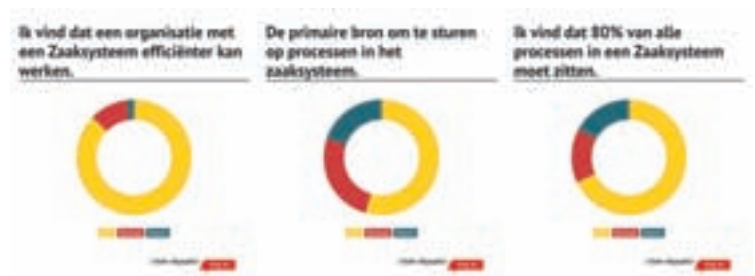
Afbeelding 5, 6 en 7. Resultaten van het onderzoek

Hieronder enkele resultaten van het onderzoek tijdens het event: