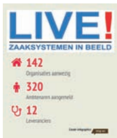
Afbelding 1. O pkomst event