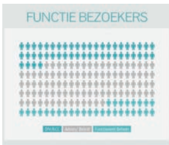
Afbelding 2. F unctie bezoekers

Ruim 300 ambtenaren kregen de kans om twaalf verschillende zaaksystemen te zien en te ervaren. In een ruime hal stonden