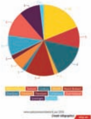
Afbeelding 4. Percentage gemeenten zonder zaakstelsel